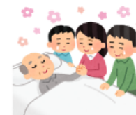
病気でも家で最期まで過