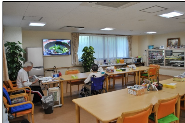
広々とした食堂兼談話室です