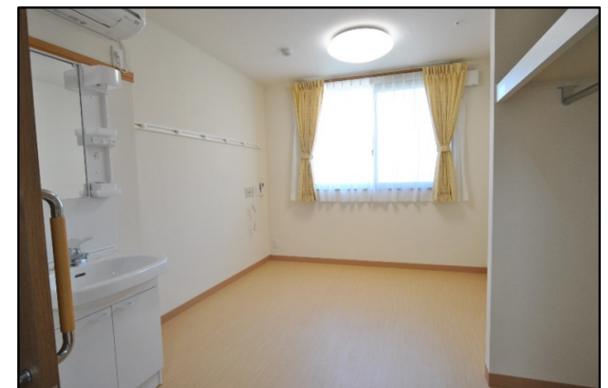
明るくて清潔感のある心地よい居室でおくつろぎください